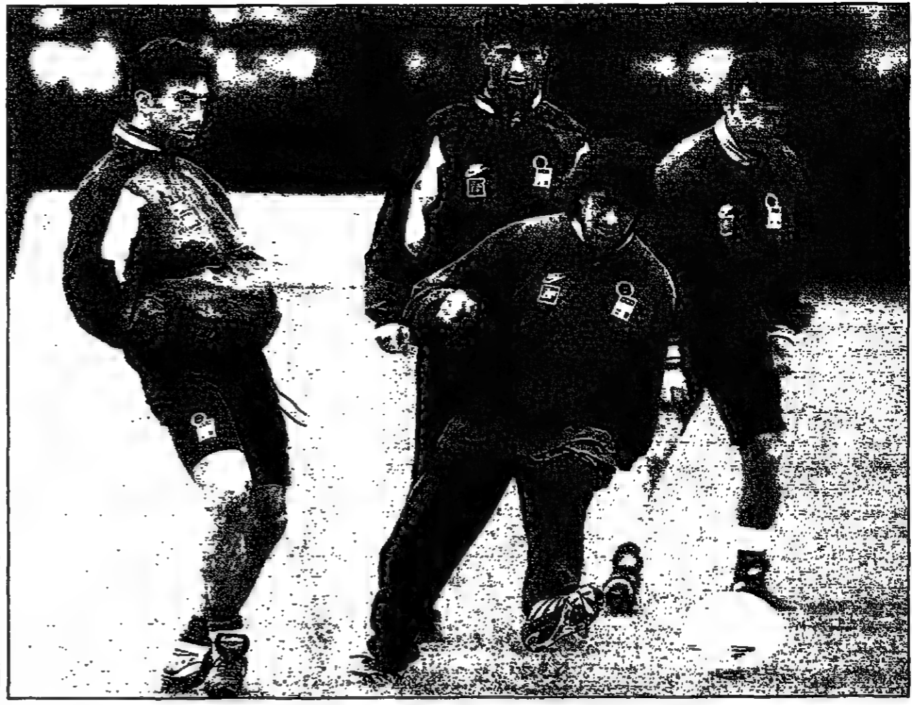
لحظة أثناء مباريات المنتخب الايطالي اس ويظهر اللاعب السامو ديلبير في الوسط